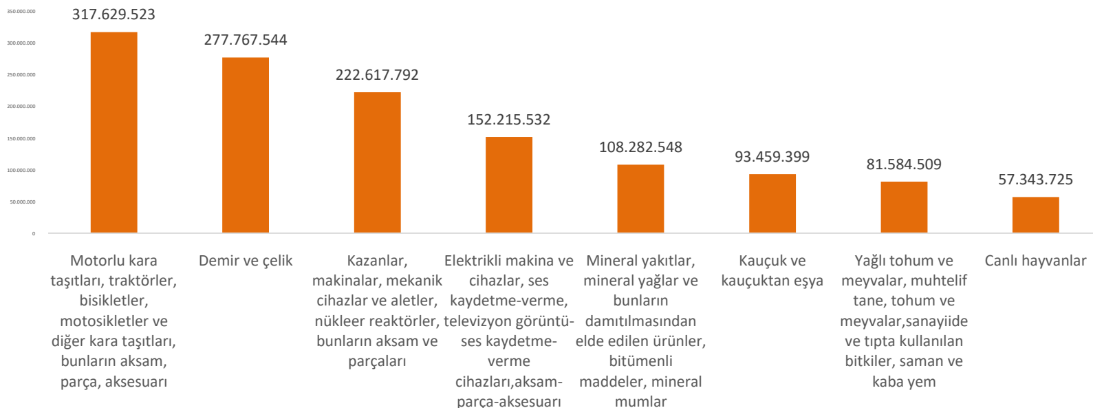
2018/8 aylık dönemde Türkiye'ye Romanya'dan En Fazla İthal Edilen Ürünler($)

2018 yılının ocak-ağustos döneminde Türkiye'ye Romanya'dan yapılan ithalat tutarı 1.791.553.291 dolar olarak gerçekleşmiştir. En fazla ithal edilen ürünler aşağıdaki tabloda yer almaktadır.